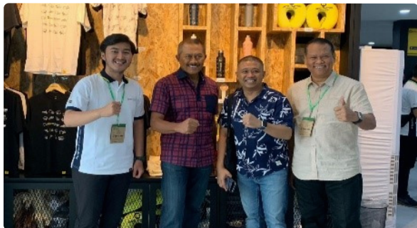
Kunjungan Booth dari Komisaris Independen UT dan Pembina Kopkar Kanitra