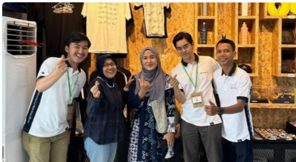
Kunjungan Booth dari Pengawas & Ketua Kopkar Kanitra

Kehadiran Kopkar Kanitra di Mining Exhibition 2024 diharapkan menjadi langkah awal untuk memperluas jangkauan koperasi di pameran industri. Kopkar Kanitra memiliki peluang besar untuk tumbuh, mendukung kesejahteraan karyawan UT dan bersaing di industri yang lebih luas. Kesempatan ini diharapkan membuka lebih banyak peluang peningkatan kesejahteraan bagi anggota koperasi.