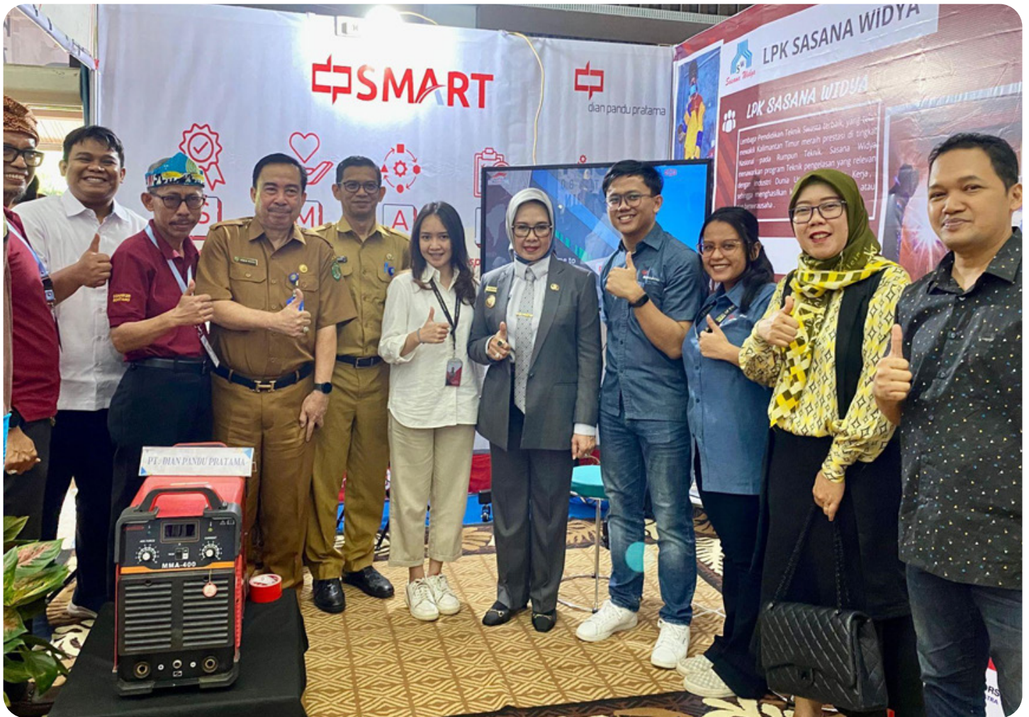
Tim DPP Bersama dengan Wakil Walikota Bontang dan Perwakilan Dinas Ketenagakerjaan