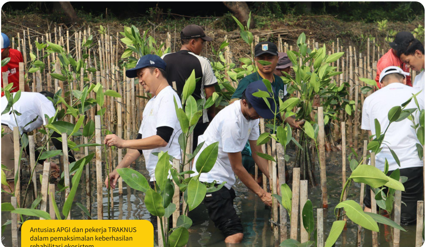
Antusias APGI dan pekerja TRAKNUS dalam pemaksimalan keberhasilan rehabilitasi ekosistem