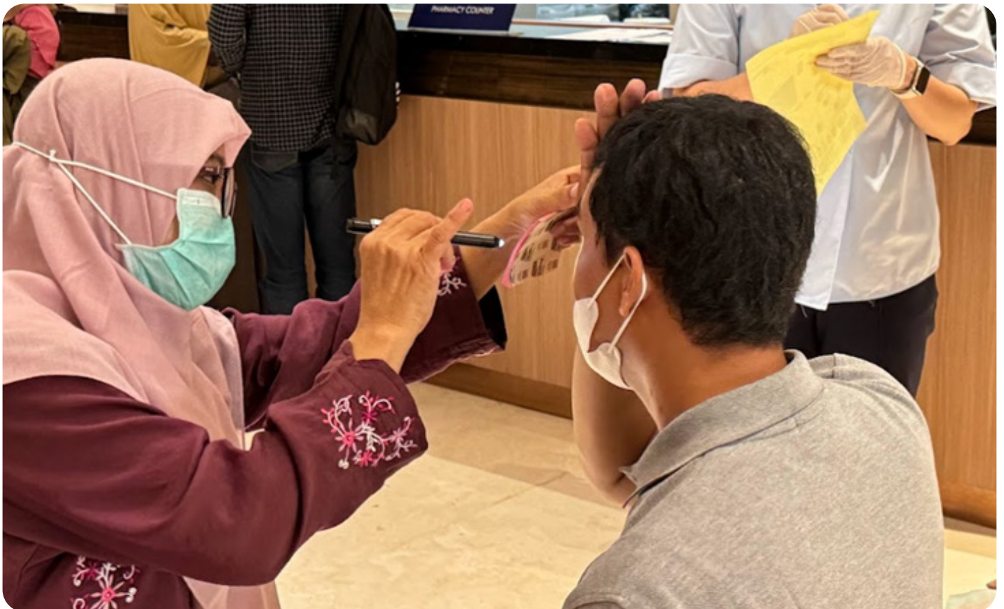
Pemeriksaan pra-operasi yang dilakukan oleh nakes pihak siloam