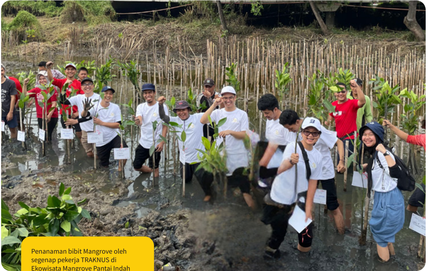
Penanaman bibit Mangrove oleh segenap pekerja TRAKNUS di Ekowisata Mangrove Pantai Indah Kapuk (PIK), Jakarta Utara