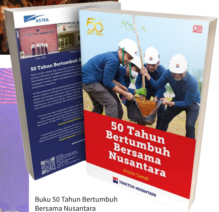
Buku 50 Tahun Bertumbuh Bersama Nusantara