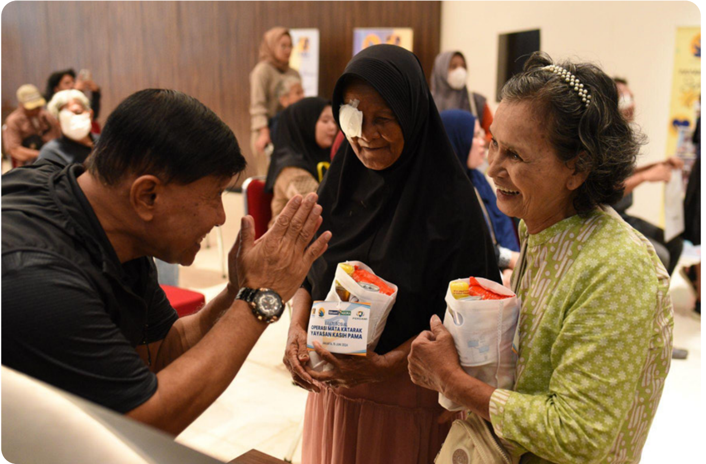
Para peserta menerima healthy kit berupa obat-obatan dan vitamin