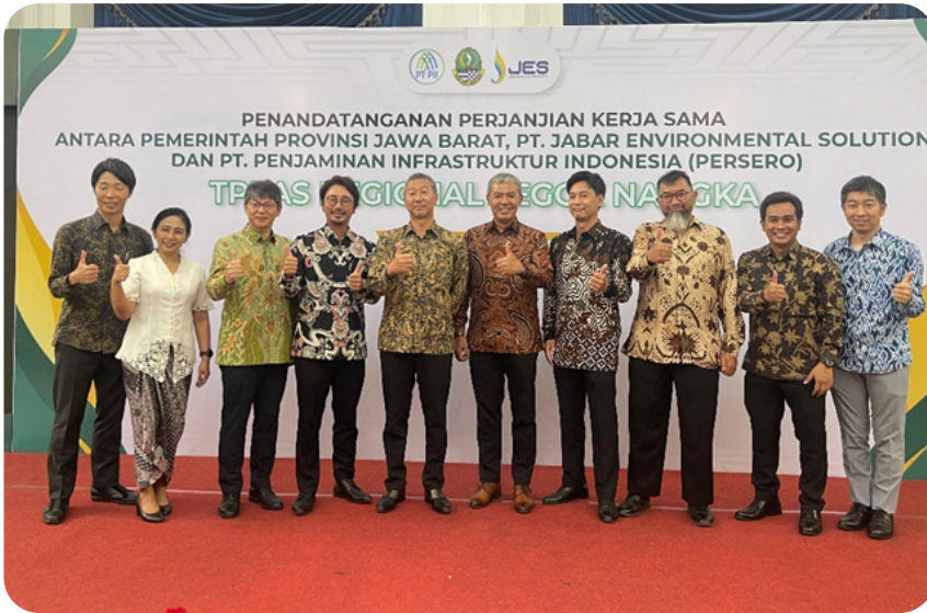
PT Jabar Environmental Solutions (JES), didirikan oleh Sumitomo Corporation, Hitachi Zosen (Hitz), dan PT Energia Prima Nusantara (EPN).