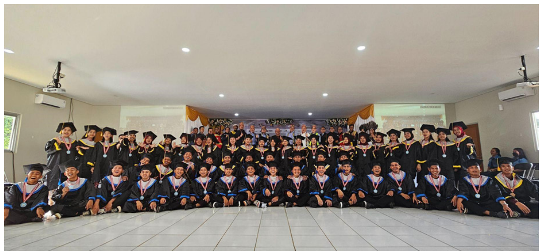
Foto bersama wisuda siswa-siswi SMK Maharati binaan Pamapersada