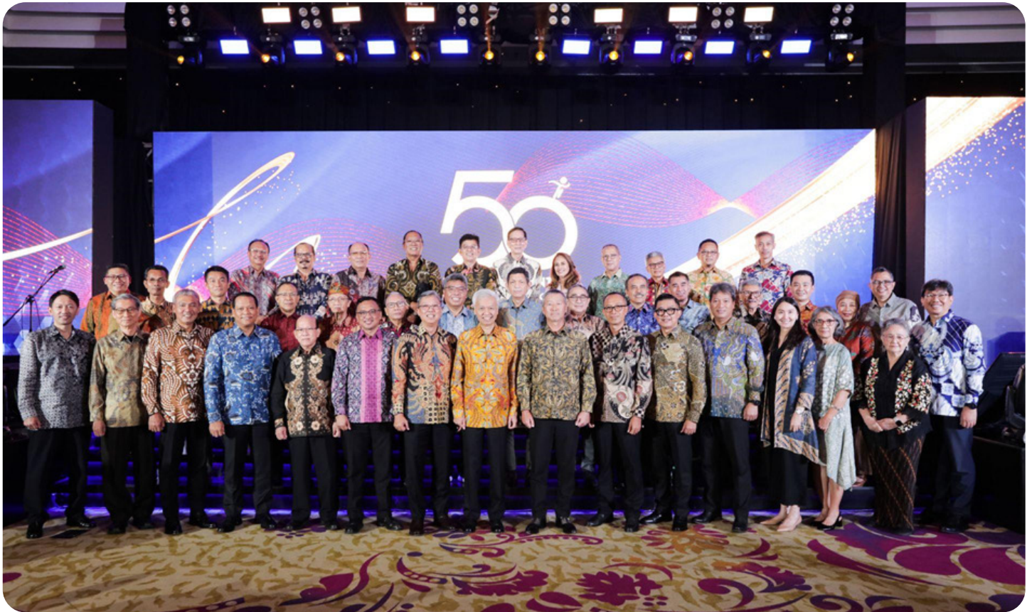
BOD TRAKNUS bersama Komisaris, BOD United Tractors, dan segenap former TRAKNUS dalam peluncuran buku di Ballroom JS Luwansa