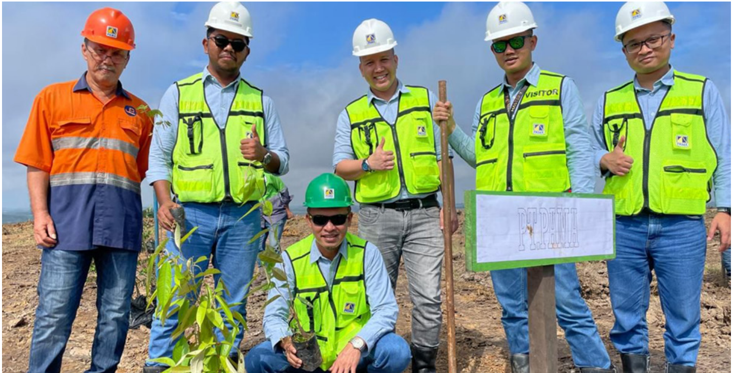
Proses penanaman bibit pohon di area yang sudah direncanakan