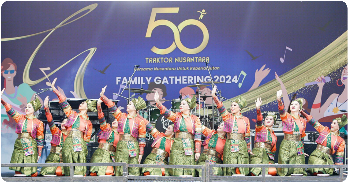
Pementasan Tari Saman pada pembukaan Family Gathering TRAKNUS 2024 simbol keberagaman, nilai kekompakan dan nilai kebersamaan.